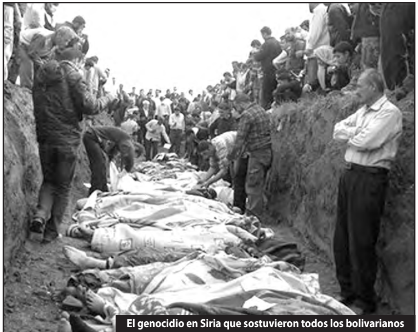
El genocidio en Siria que sostuvieron todos los bolivarianos

sonríe ante sus bufones. En tercer lugar “manifiesta seria preocupación por la grave situación humanitaria y de seguridad en la República Árabe Siria, y por la amenaza que representa para el Oriente Medio y para la paz y la seguridad internacionales”. Es decir brindaron todo su apoyo a la Cumbre de Ginebra II para sostener el genocidio de Al Assad a cuenta del imperialismo contra las masas sirias. En Cuarto lugar “También reafirmaron la voluntad de impulsar programas regionales, subregionales bilaterales y triangulares de cooperación para el desarrollo, así como una política regional de Cooperación Sur-Sur y Triangular, que tengan en cuenta las características y necesidades específicas de las diversas áreas y sub regiones, así como de cada uno de los países”, Wall Street y las transnacionales vieron cumplidas sus expectativas.