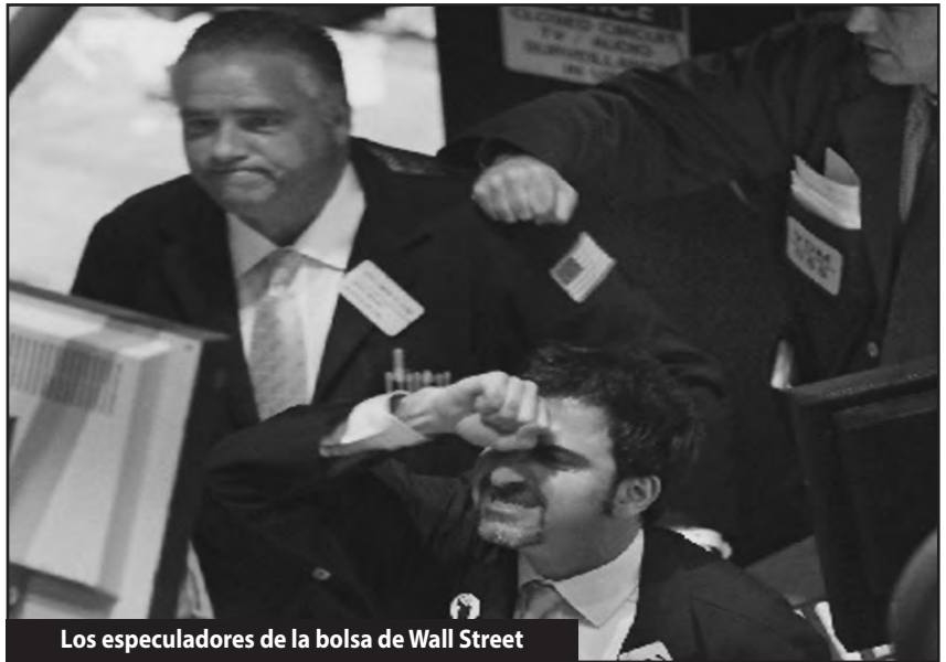
Los especuladores de la bolsa de Wall Street

En esta ofensiva el imperialismo yanqui pasó por arriba y destruyó o dejó en grave crisis todas las instituciones de dominio del imperialismo del período de Yalta como la ONU, OEA, OTAN etc. Sin embargo la heroica resistencia iraquí y el surgimiento de un movimiento antiguerra al interior de la bestia yanqui tipo “Vietnam” que se desarrollaba como parte también del ascenso revolucionario en todo el continente americano, empujó al imperialismo yanqui y lo dejó en crisis. Ante el crac mundial que estalló en 2008 y las respuestas revolucionarias de las masas en Europa, Norte de África y Medio Oriente e inclusive al interior de los EE.UU. con los explotados cercando Wall Street y señalándolo como el principal enemigo de los pueblos del mundo, EE.UU. le tiró todo el peso de la crisis mundial al plantea, a sus competidores imperialistas y a las naciones coloniales y semi coloniales. Esto es así a pesar de los charlatanes del reformismo que siguen hablando de “decadencia norteamericana, “confundiendo” su crac económico, que éste le arroja a las masas y al mundo entero, con su “caída” en el dominio del planeta, de sus zonas de influencia y de un retroceso en su productividad del trabajo, cuestiones estas tres últimas que no sólo no son correctas, sino que son todo lo contrario. Lejos de desarrollar una tendencia “aislacionista” EEUU ha capturado todos los dólares del mundo para cubrir su déficit que llega ya a los 17 billones de dólares. Esto demuestra que la potencia domi-