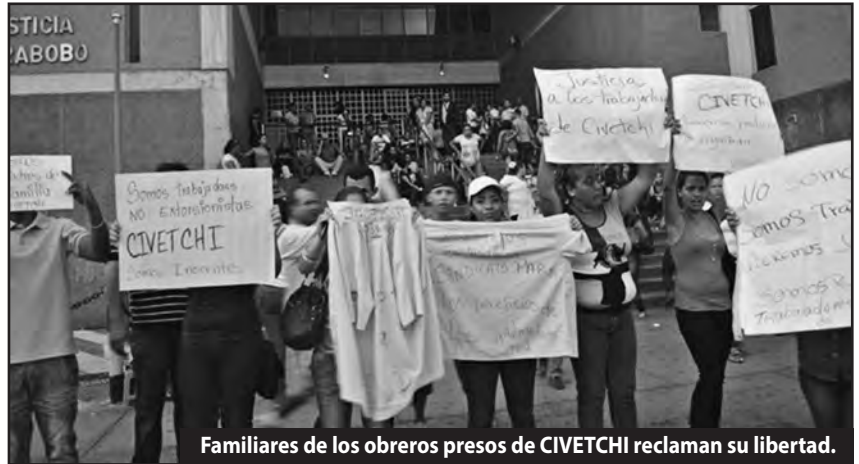
Familiares de los obreros presos de CIVETCHI reclaman su libertad.

trabajo digno, contra el desabastecimiento, la carestía de la vida y contra el FMI: la clase obrera venezolana, rompiendo con la boliburguesía y entrando al combate por sus demandas, es la única que puede salvar a la nación, acaudillando al conjunto de las clases oprimidas