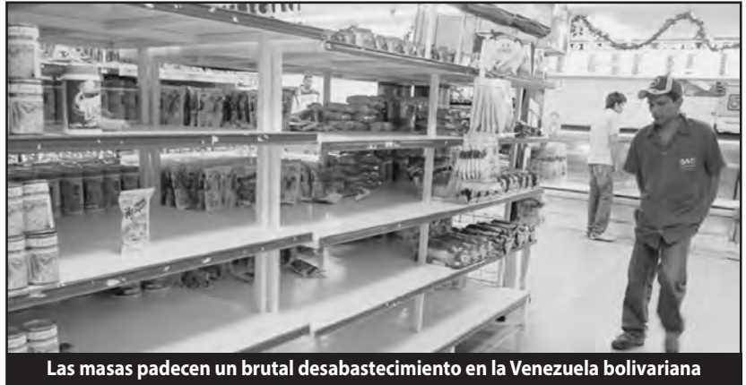
Las masas padecen un brutal desabastecimiento en la Venezuela bolivariana

por las “expropiaciones socialistas”. El pago de la fraudulenta deuda externa que constituye una pesada carga sobre las espaldas de los explotados, y que demuestra la total sumisión de los bolivarianos al imperialismo. La emisión de enormes cantidades de billetes sin respaldo en riqueza material -para cubrir los déficits generados por el saqueo de la nación- pulverizaron el valor del bolívar y el poder adquisitivo del pueblo. En esta situación, las pandillas rapaces del gran capital han provocado una brutal inflación del 56 %, que liquida el salario de la clase obrera. Las transnacionales y la burguesía comercial-importadora reciben los dólares que les otorga el gobierno a Bs. 6,30 (valor oficial del dólar). Así importa las mercancías que Venezuela no produce y que las masas consumen, las acapara y remarca los precios a los niveles del dólar del mercado negro, hoy entre Bs. 75 y 80. En un país que importa el 70 % de lo que consume, la escasez y las penurias del pueblo son un negocio formidable para la burguesía. En enero pasado, Maduro aplicó una nueva devaluación que llevó el dólar a 11 bs. para todos los bienes que no sean alimentos y medicinas. En las últimas semanas, tanto Maduro como Rafael Ramírez reconocieron la necesidad de eliminar el