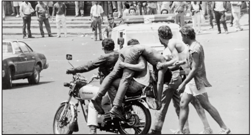
1989, las masas dejan sus mártires combatiendo en el “Caracazo”

Fue el Caracazo el que dejó herida de muerte a la IV República y a su plan de ataque a las masas. Fue una verdadera semi insurrección de masas que