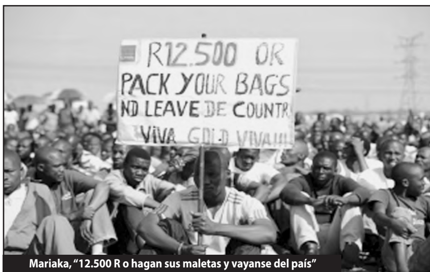
Mariaka, “12.500 R o hagan sus maletas y vayanse del país”

No es casual que tanto el gobierno como la patronal quieran declarar esta lucha ilegal para tener las manos libres para reprimir a los obreros, como ya lo hicieron en agosto del 2012 llevando adelante una verdadera masacre al estilo de Sharpeville y Soweto (1960 y 1976, dos grandes masacres obreras comandadas por el régimen del Apartheid). El gobierno del CNA sabe que este año va a elecciones y que se tiene que cuidar muy bien antes de salir a reprimir porque la matanza del 2012 le significó a Zuma en particular y al CNA en gene-