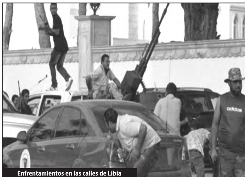
Enfrentamientos en las calles de Libia

Un sector de las milicias rebeldes se dio cuenta de esta conspiración montada por el