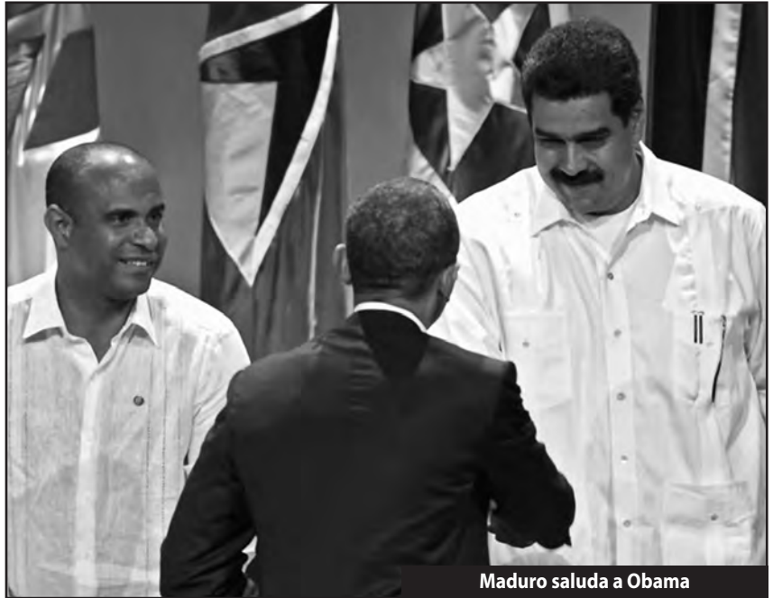
Maduro saluda a Obama

ofensiva contra las masas quitando el subsidio al combustible para garantizar el pago de la deuda al FMI y las superganancias de las transnacionales. Ése es su rol bajo la tutela de Obama, que lo usa como a un limón al que le está exprimiendo todo el jugo. Por ello Maduro, apoyado por Capriles, lanzó en 2013 y principios de 2014 un brutal ataque contra la clase obrera y contra las clases medias arruinadas. Con el proletariado bajo la bota del chavismo gracias a la traición de sus direcciones, las clases medias arruinadas y desesperadas por la devaluación, la inflación y el desabastecimiento ganaron las calles pidiendo “seguridad”, “libertad”, “dólares frescos” buscando una salida reaccionaria a su bancarrota.