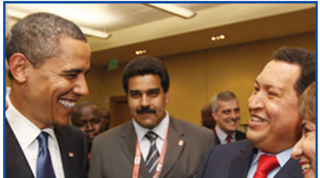
Obama y Chávez se saludan. Los "bolivarianos" lo nombraron su candidato en las últimas elecciones en EE.UU.

Maduro con devaluación, inflación, congelando el salario, busca recaudar U$S15.500 millones para pagarle la fraudulenta deuda externa al FMI