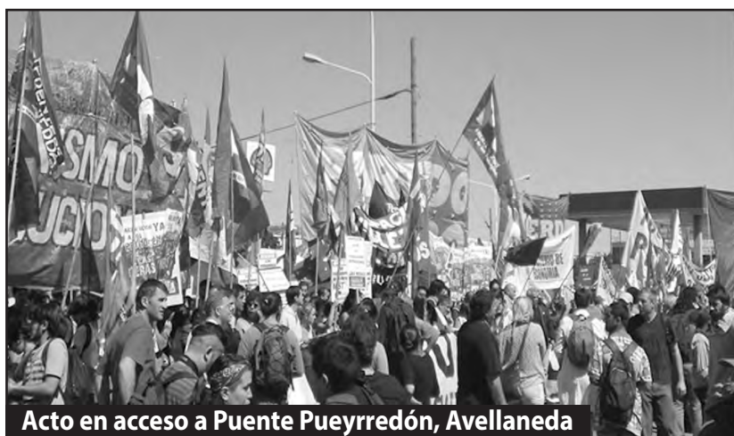
Acto en acceso a Puente Pueyrredón, Avellaneda

Decenas de organizaciones obreras, de derechos humanos, estudiantiles y partidos de izquierda, a pesar de la dura represión, protagonizan el corte de la Panamericana en Zona Norte, de la avenida General Paz en Liniers y un acto en Avellaneda en uno de los accesos al Puente Pueyrredón