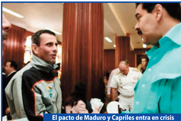
El pacto de Maduro y Capriles entra en crisis

El gobierno se recuesta en las Fuerzas Armadas para atacar a los trabajadores y el pueblo.