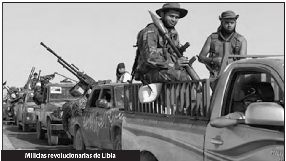
Milicias revolucionarias de Libia

Le pedimos a los pobres y explotados de Europa que sufren lo que sufrimos que nos apoyen en esta lucha por recupe-