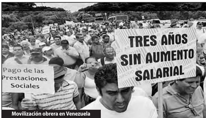
Movilización obrera en Venezuela

Otras corrientes de la izquierda proclaman que la “clase obrera debe