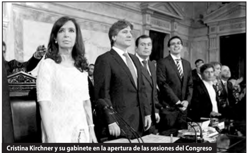
Cristina Kirchner y su gabinete en la apertura de las sesiones del Congreso

En el estado de los explotadores se dividen los roles y las tareas para someter a los trabajadores: los políticos patronales engañan al pueblo, los jueces se unen para reprimir y perseguir a los luchadores, con el Ministerio de Trabajo se controla y corrompe a las organizaciones obreras, mientras el genocida Milani y las Fuerzas Armadas se preparan para aplastar a las masas en caso de que irrumpen con su lucha como en el 2001. Pero todos están encolumnados tras el gobierno de Cristina Kirchner. Las