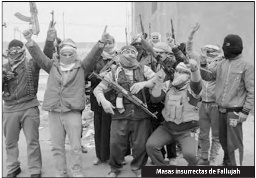
Masas insurrectas de Fallujah

Pero las masas de Fallujah y Ramadi no han sido derrotadas. Están aisladas sufriendo el terrible bombardeo del ejército iraquí a cuenta del imperialismo yanqui. El accionar de su dirección le impide desarrollar su lucha como tal en Iraq y en Siria. Hay que romper su aislamiento. Por eso hay que desarrollar los métodos de lucha de las masas, sobrepasando