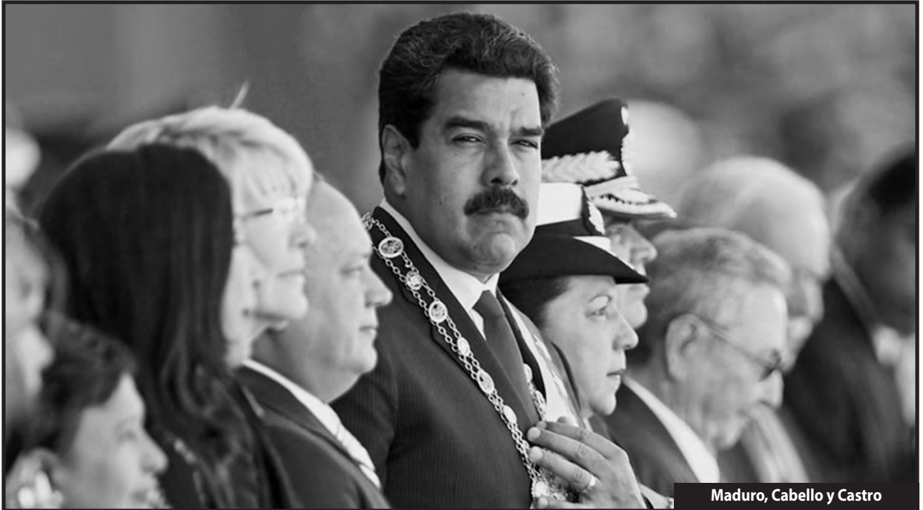
Maduro, Cabello y Castro

Maduro se recuesta en las Fuerzas Armadas para atacar a los trabajadores y el pueblo, mientras la "derecha" levanta cabeza para terminar su obra