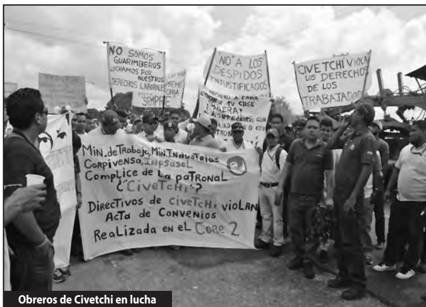
Obreros de Civetchi en lucha

Para imponer este camino urgente, la tarea del momento es recuperar la UNT y las organizaciones de lucha para nuestra clase, sobre la base de la más amplia democracia obrera e independencia frente al Estado. Hay que convocar de inmediato UN GRAN CONGRESO DE DELEGADOS DE BASE DE TODO EL MOVIMIENTO OBRERO PARA REFUNDAR LA UNT. Hay que coordinar a los que luchan y ¡romper con la burguesía, con SU gobierno y el control estatal