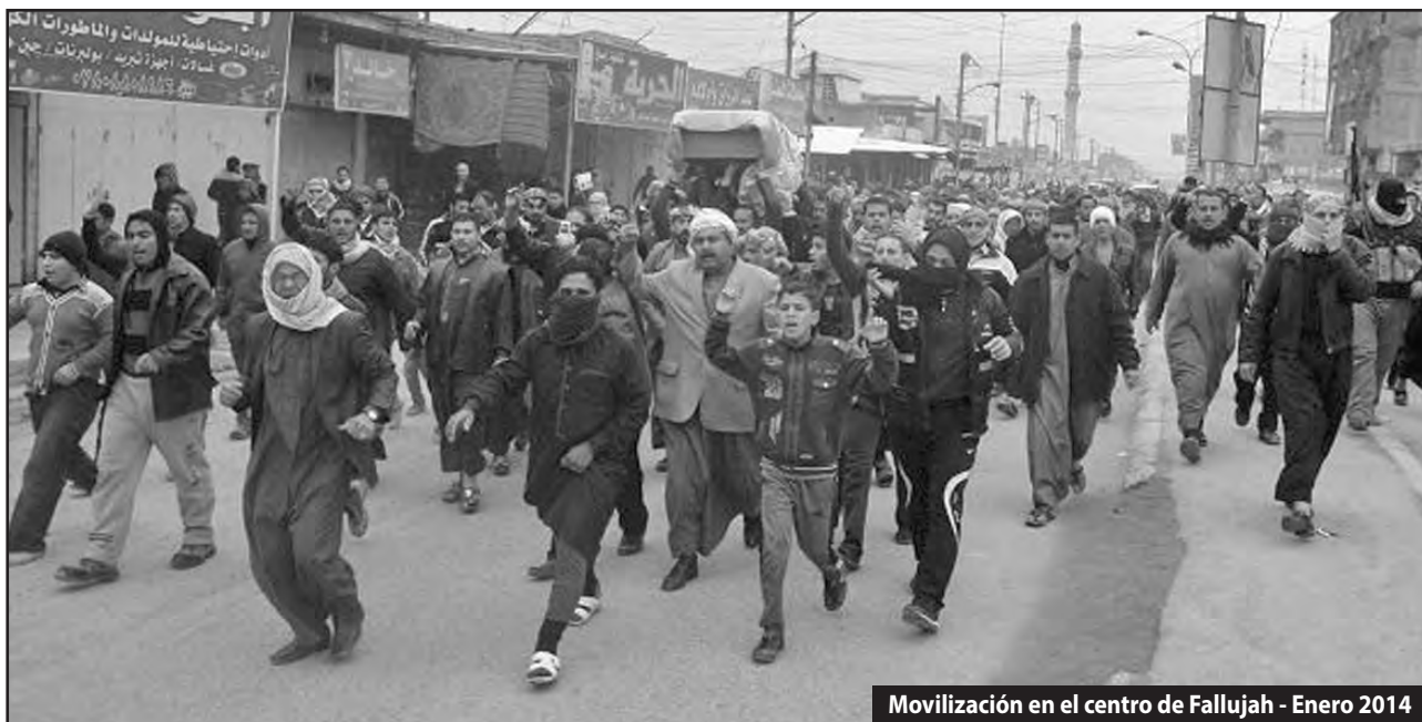
Movilización en el centro de Fallujah - Enero 2014

¡Hay que retomar el rumbo revolucionario de su lucha, en Irak, Siria y toda la región y romper con el curso de acción y situación que le han impuesto sus direcciones!