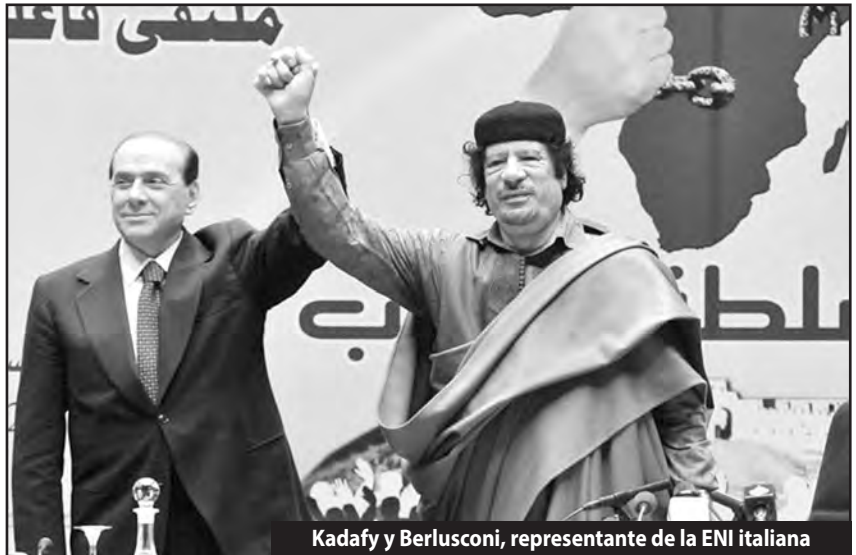
Kadafi y Berlusconi, representante de la ENI italiana

Los responsables de este “faltante” han sido todos aquellos que, por un lado, hablando en nombre de la revolución “democrática”, (como la LIT y el NPA de Francia), les dijeron a los explotados libios que con asam-