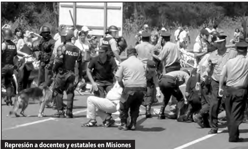
Represión a docentes y estatales en Misiones

Ninguna ley del Parlamento de los explotadores podrá detener el ataque despiadado que nos han largado, pues desde allí ya nos han declarado la guerra. Ningún fallo de los jueces será favorable, pues ellos nos condenan a cárcel y cadena perpetua, y persiguen a más de 7000 compañeros procesados. Sólo los trabajadores preparando una gran lucha podremos derrotar el ataque de los capitalistas.