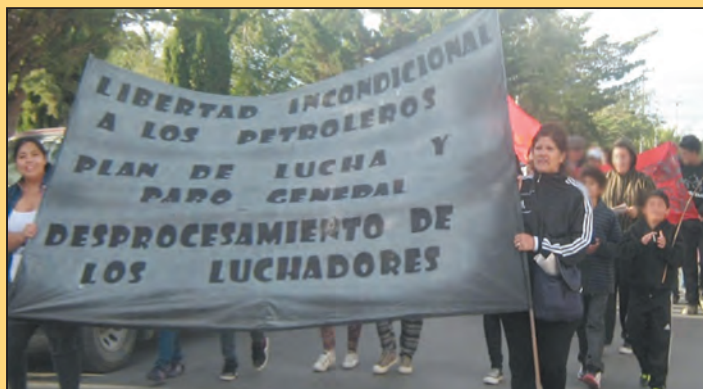
27 de febrero: La Comisión de Trabajadores Condenados, Familiares y Amigos de Las Heras... (Congreso 12/10) encabeza la movilización en Las Heras junto a decenas de trabajadores petroleros y jóvenes

Ya perdimos el miedo ¡Fuera los jueces y fiscales videlistas de las petroleras imperialistas!