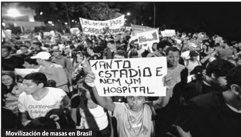
Movilización de masas en Brasil

Para romper con el imperialismo la clase obrera debe romper todo sometimiento a la burguesía bolivariana y sus instituciones ¡Basta de que nuestras organizaciones de lucha estén a los pies de nuestros enemigos de clase! Ayer la izquierda reformista llamó a juntarle 10 millones de votos a Chávez, hoy se trata de sublevar a más de 10 millones de obreros para intervenir como clase en la crisis política actual y enfrentar esta catástrofe de hambre y miseria inaudita, para volver a ponernos de pie contra el im-