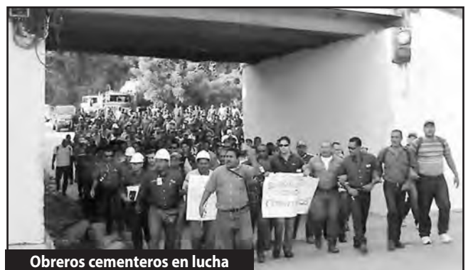
Obreros cementeros en lucha

¡Por los Estados Unidos Socialistas de Latinoamérica y El Caribe!