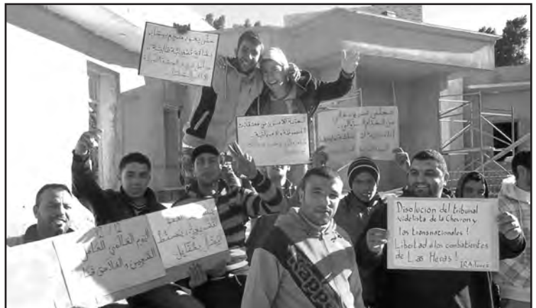
Trabajadores de Tunes en apoyo a los trabajadores de Las Heras

¡Una sola y misma lucha de la clase obrera mundial!