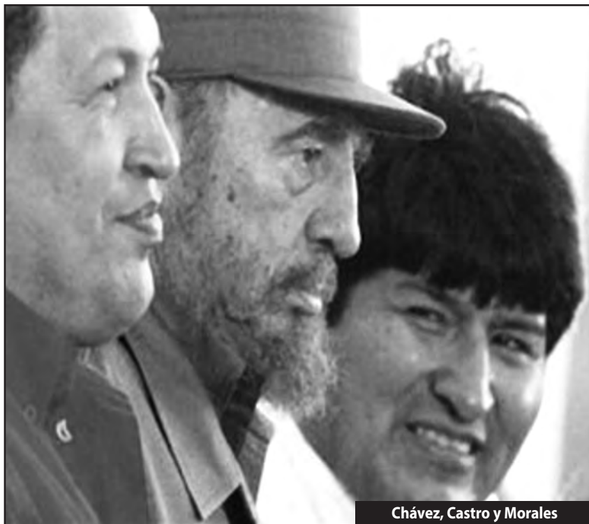
Chávez, Castro y Morales

bolivarianos fue la consumación de esta misión. Castro, Chávez y la izquierda reformista fueron los mejores electores de Obama con su campaña primero “Todos contra el fascista Bush”, “cualquiera menos Bush”, y luego “Todos contra el fascista Tea Party”... es decir siempre todos con el “democrático” Obama e impidieron que en todo el continente americano se pelee como en el Norte de África y Medio Oriente.