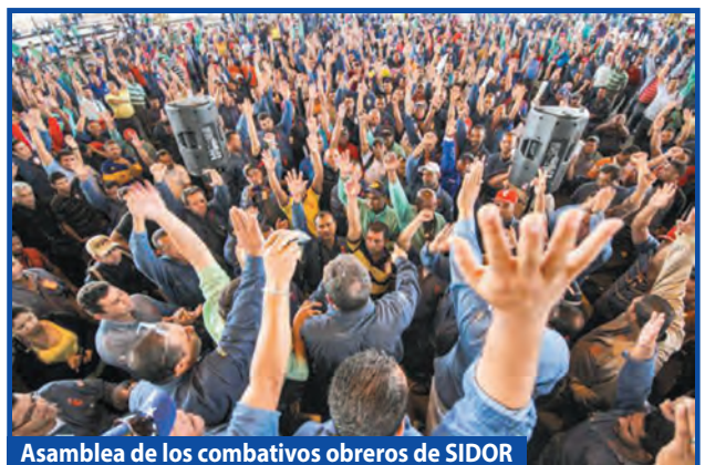
Asamblea de los combativos obreros de SIDOR

Para imponer todas las demandas de los explotados, derrotar el ataque de Maduro, enfrentar a la oligarquía de los "López", romper con el FMI y expropiar a los capitalistas