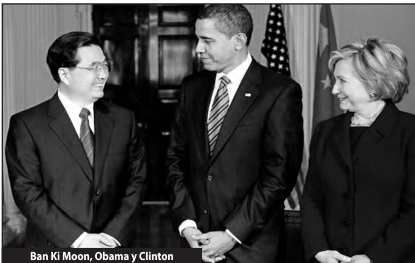
Ban Ki Moon, Obama y Clinton

que le permiten al imperialismo un relativo equilibrio económico, político y militar . Se trata de recomponer instituciones de dominio para consolidar lo conquistado, asentar la contraofensiva contrarrevolucionaria del imperialismo yanqui y prepararse para nuevos golpes de la crisis mundial capitalista . Lo que se reunió en La Habana fue un Consejo de ministros de las transnacionales bajo la dirección de la ONU para devolverle todo el poder a Wall Street y a las potencias imperialistas en el continente luego de expropiar, contener y derrotar la revolución.