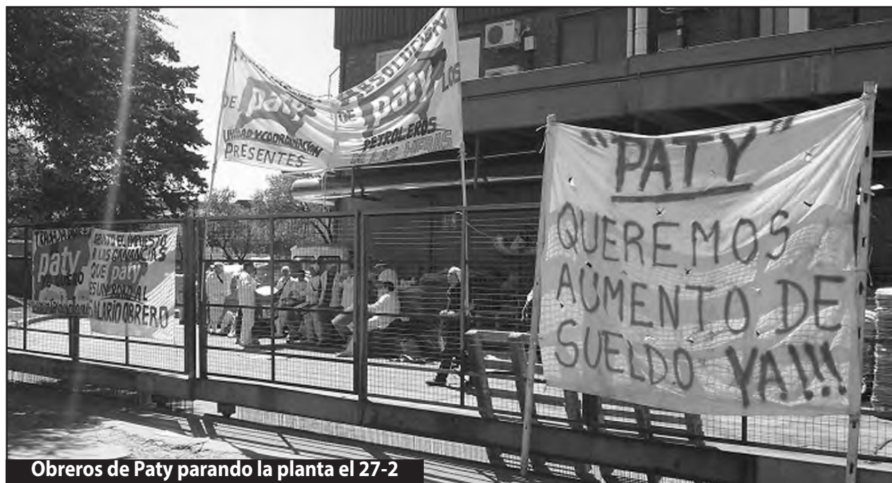
Obreros de Paty parando la planta el 27-2

Los trabajadores de la Línea C del subte levantaron los molinetes 1 hora en apoyo a la lucha de los petroleros