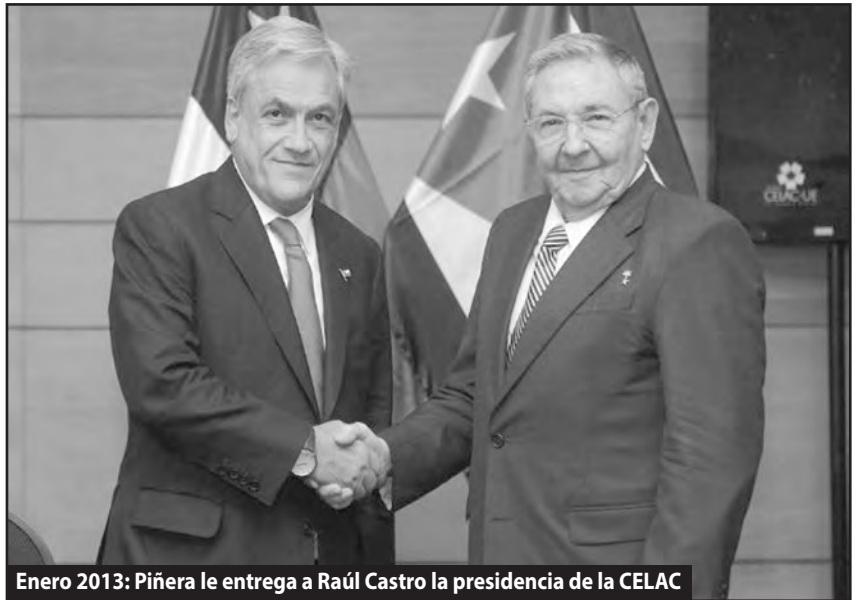
Enero 2013: Piñera le entrega a Raúl Castro la presidencia de la CELAC

En esa "Expo- naciones", se podía ver entonces también, no solo a los estranguladores de la revolución proletaria, como Morales en Bolivia, a los hermanos Castro, sino también a los sicarios y asesinos a cuenta del imperialismo como el gobierno Mejicano, el Hondureño, los centroamericanos, el régimen de oprobio y masacre como es el colombiano abrazados como lo están desde hace rato a sus amigos de La Habana y Ecuador... El cinismo de las burguesías latinoamericanas no tiene límites: hacer pasar como un gobierno "democrático" al régimen semi fascista de Uribe-Santos, equivale a querer ocultar un elefante en un baño. Y lo siguen intentando. Allí estaban no sólo los lacayos y gerentes que intentan impedir la irrupción de las masas, o que éstas entren en acciones revolucionarias como en Brasil, Perú o Chile, sino que también se ofrecieron limones exprimidos y a exprimir, para que terminen de atacar a las masas, inclusive a riesgo de debilitarse a grado extremo. Maduro encabezó ese pelotón y la Kirchner de Argentina decía en todos lados "Maduro a mí no me dejes afuera". Cada uno cumple el rol que sus jefes, las potencias imperialistas, le asignan. De Chile fueron Piñera y Bachelet, bien agarrados de la mano