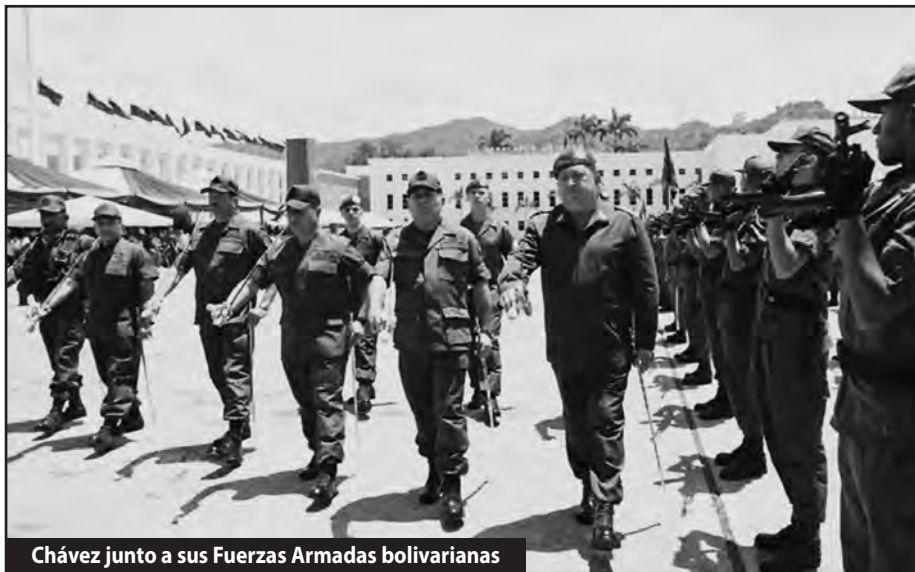
Chávez junto a sus Fuerzas Armadas bolivarianas

Las elecciones presidenciales de abril de 2013 habían fortalecido a Capriles con más del 45% de los votos, pero dejaron relativamente débil al gobierno de Maduro, que cargaba con la crisis política tras la muerte de Chávez y no lograba la legitimidad suficiente para seguir pasando los planes antiobreros de entrega de la nación que exigían Obama y el FMI. Las elecciones municipales del 8 de diciembre apuntalaron a Maduro, lo que configuró un triunfo reaccionario del conjunto del régimen bolivariano bipartidista. Como en los años del pacto del Punto Fijo del COPEI y la AD, estas últimas elecciones repartieron la “renta petrolera” entre los dos partidos principales del régimen de la Constitución Bolivariana: el PSUV ganó a nivel nacional y la MUD triunfó en las grandes ciudades. Las distintas fracciones de la burguesía habían copado toda la escena política del país mientras el proletariado se encontraba bajo el férreo control del chavismo con los sindicatos completamente estatizados y una brutal represión antiobrera. Al contrario de lo que plantearon las corrientes de la izquierda reformista —que solo hablaban de decadencia del chavismo y de derrota electoral de la MUD— el régimen se había fortalecido enormemente bajo el Pacto Obama-Maduro-Capriles sobre la base de derrotar la oleada de huelgas obreras de octubre —noviembre. Estas fueron las condiciones que le permitieron