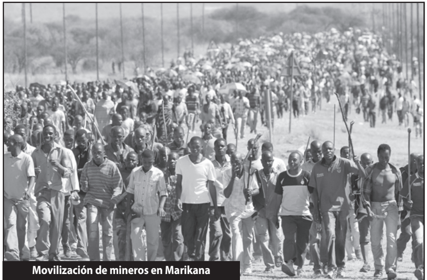
Movilización de mineros en Marikana

El combate de los obreros del sur de África marca el camino para romper las cadenas con las que los parásitos de Wall Street intentan estrangular a los explotados del mundo. ¡Ellos marcan el camino!