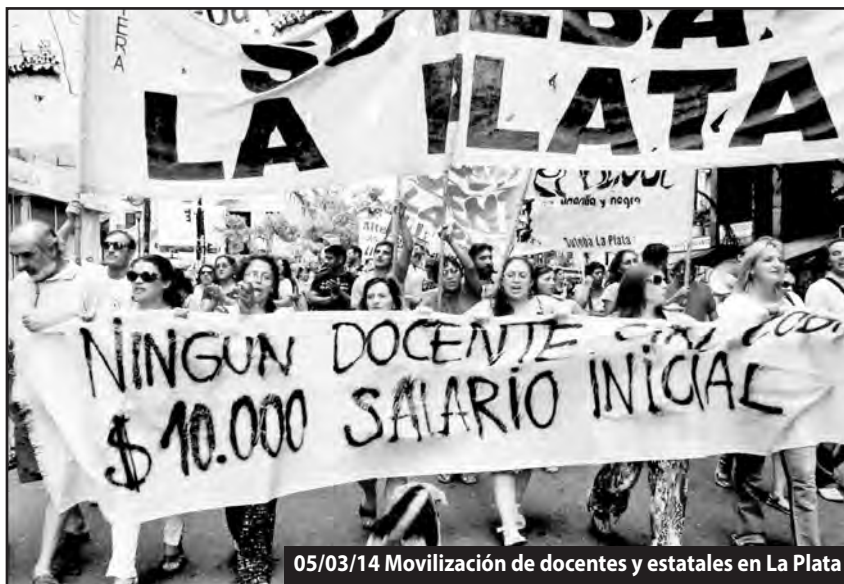
05/03/14 Movilización de docentes y estatales en La Plata

Por eso los que deben recibir su castigo e ir a la cárcel son los políticos patronales que tienen las manos manchadas de sangre obrera como los Menem, De la Rúa, Sobisch, Ro-