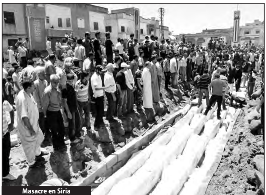
Masacre en Siria