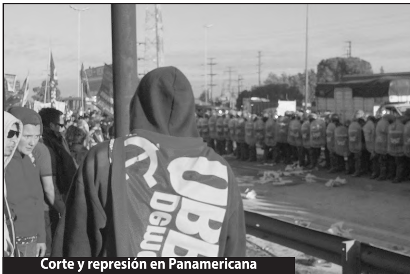
Corte y represión en Panamericana

Decenas de organizaciones obreras, de derechos humanos, estudiantiles y partidos de izquierda, a pesar de la dura represión, protagonizan el corte de la Panamericana en Zona Norte, de la avenida General Paz en Liniers y un acto en Avellaneda en uno de los accesos al Puente Pueyrredón