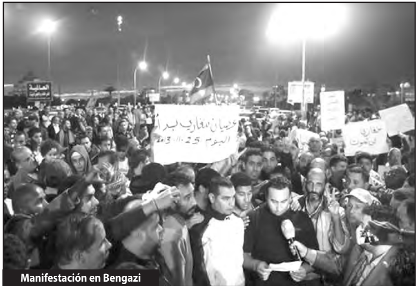
Manifestación en Bengazi

Las milicias rebeldes sacaban pronunciamientos desconociendo las declaraciones proclamadas por los altos mandos de Misratta y Zenten de sostenimiento del CNL. La crisis política avanzaba una vez más. Un Congreso Nacional de delegados de los Obreros Petrole-