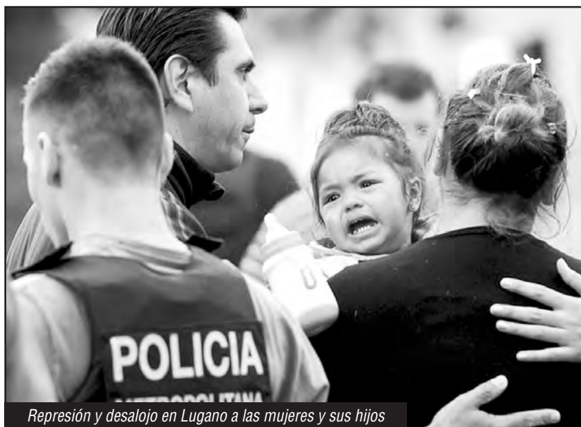
Represión y desalojo en Lugano a las mujeres y sus hijos

¡Que vuelva el movimiento piquetero a ponerse de pie luchando por trabajo digno para todos! ¡Paso a las asambleas de base! ¡Paso a los que luchan! Hay que unir al movimiento obrero retomando el camino de la Asamblea Nacional Piquetera de tra-